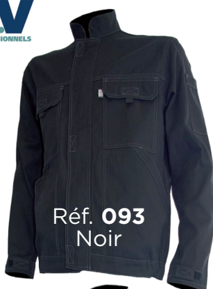
Réf. 093 Noir