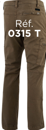
Réf. 0315 T