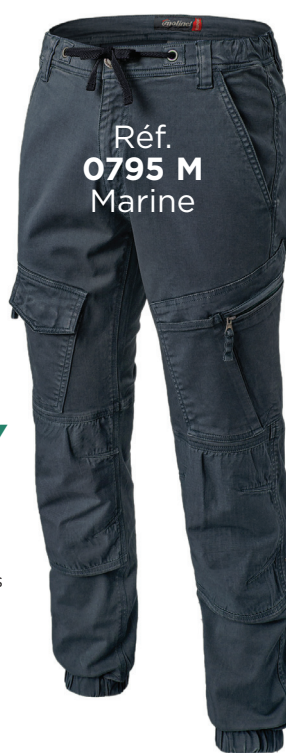
Réf. 0795 M Marine