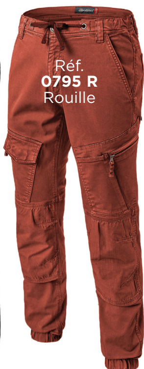
Réf. 0795 R Rouille