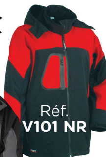
Réf. V101 NR