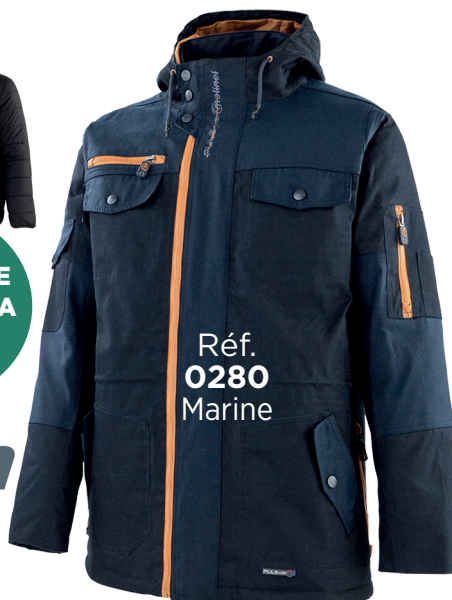
Réf. 0280 Marine