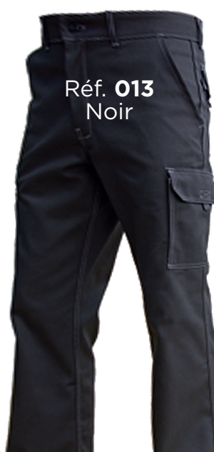
Réf. 013 Noir