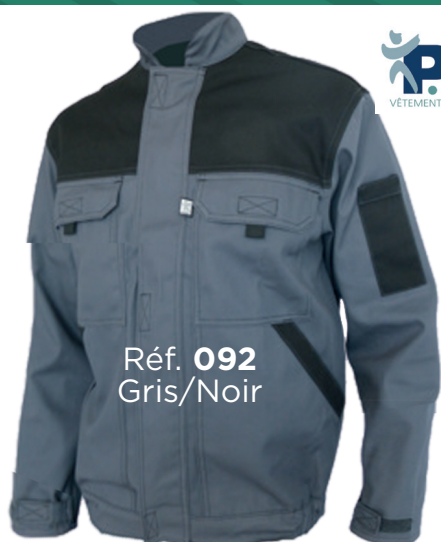
Réf. 092 Gris/Noir