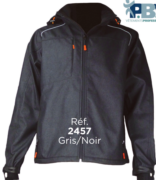
Réf. 2457 Gris/Noir