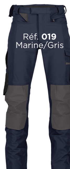
Réf. 019 Marine/Gris