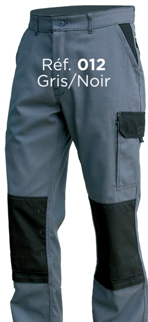
Réf. 012 Gris/Noir