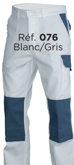
Réf. 076 Blanc/Gris