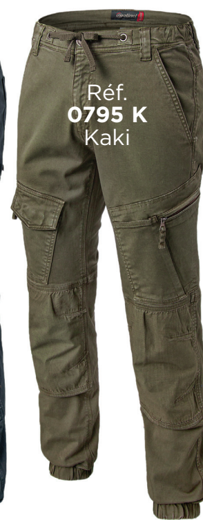
Réf. 0795 K Kaki