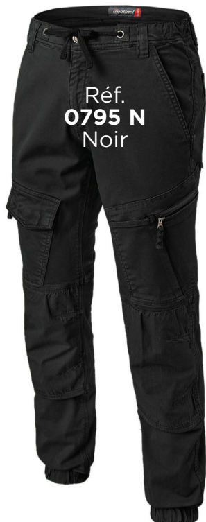
Réf. 0795 N Noir