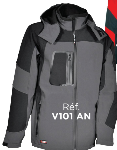
Réf. V101 AN