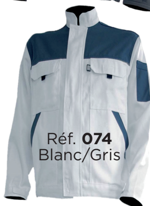
Réf. 074 Blanc/Gris