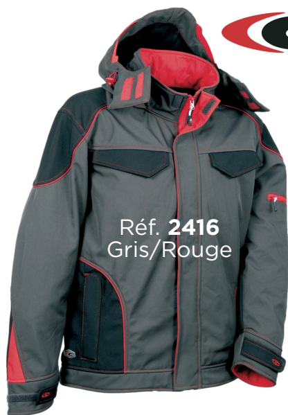
Réf. 2416 Gris/Rouge