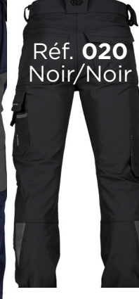
Réf. 020 Noir/Noir