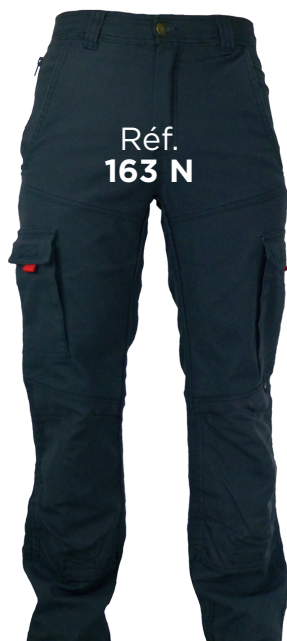
Réf. 163 N