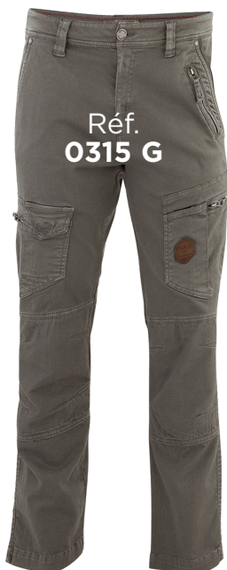
Réf. 0315 G