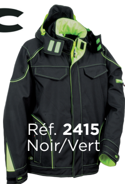
Réf. 2415 Noir/Vert