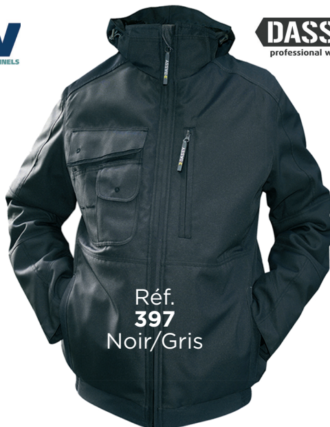
Réf. 397 Noir/Gris