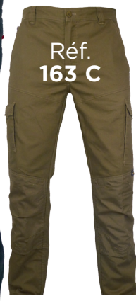
Réf. 163 C