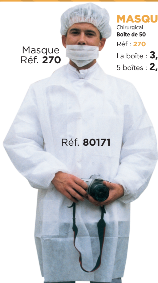
Masque Réf. 270